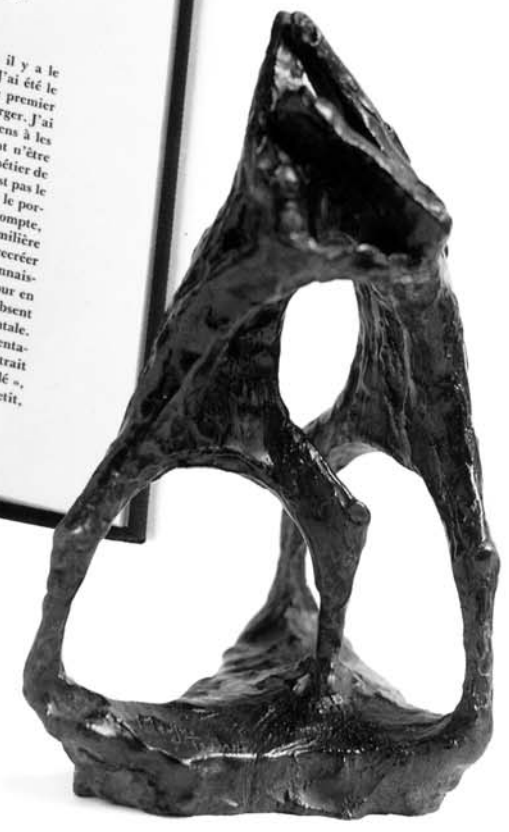
Le combat des loups

Et si nous considérons qu'avant le loup, il y a le berger. Car je suis venu du berger au loup. J'ai été le avant de créer le second. Oui, enfant, j'étais berger. J'ai vécu ainsi des moments extraordinaires. Je tiens à les rappeler. Car, sur ces moments qui pourraient à les qu'une anecdote de ma vie, j'ai construit mon métier de sculpteur. Berger ou loup, ce qui compte, ce n'est pas le fait autobiographique, ce n'est évidemment pas le por- trait en lui-même ou le souci figuratif, ce qui compte, c'est la pratique de la nature, la connaissance familière qui entraînera, un jour, l'observateur attentif à recréer un objet, un être, une situation. A les recréer en connaissant leurs détails infimes, mais en les oubliant pour en entrer d'autres qui expriment l'être intérieur, absent notre vuc et destiné à devenir vision monumentale. Sans ses menus précisions. Oublions le portait dans l'histoire des formes, j'appellerai « signolé », même, pour un portrait qui, même petit, une dimension gigantesque.